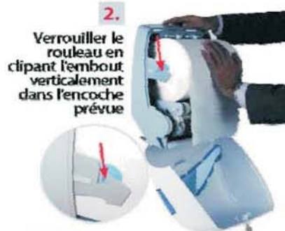
2. Verrouiller le rouleau en clipant l'embout verticalement dans l'encoche prévue