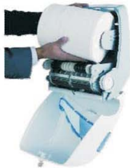
1. Mettre en place le rouleau