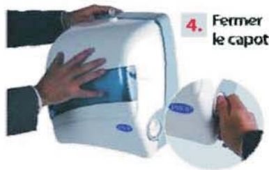
4. Fermer le capot